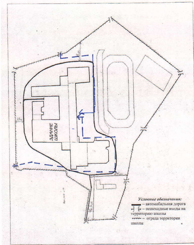
Схема расположения МБОУ СОШ г. Нытва

----- → направление движения транспорта от автовок